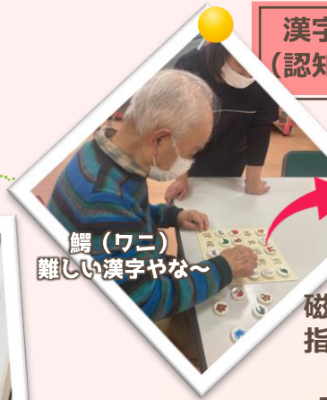
鱈(ワニ) 難しい漢字やな~